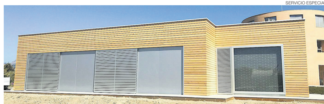
Secadero de plantas aromáticas construido por Valentia.

Estos productos están hechos con plantas aromáticas.