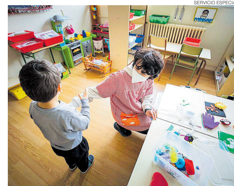
Una auxiliar atiende a un alumno en un colegio público inclusivo de Zaragoza.

Todos ellos requieren de apoyo docente y tecnología adaptada. Y