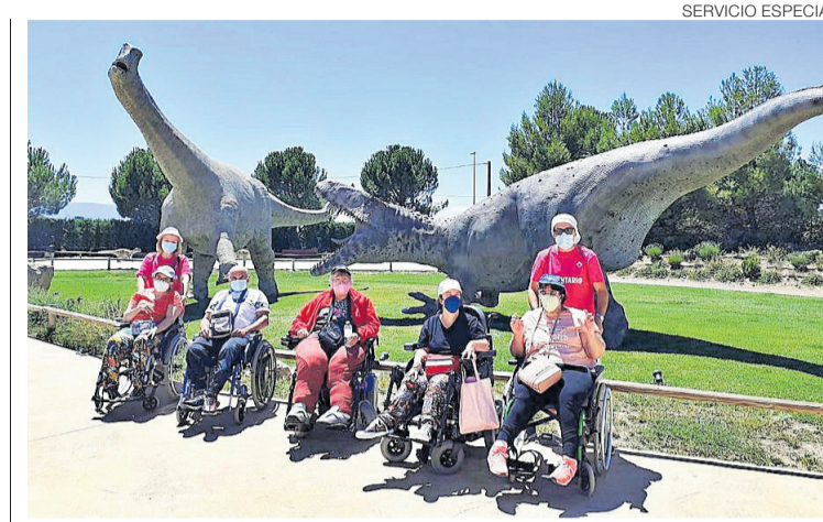
Excursión para conocer Dinópolis en Teruel.

Más de 50 personas usuarias de la fundación han participado en